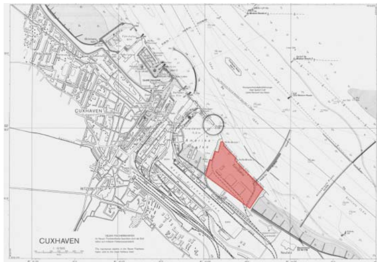
Abb. 1: Lage des CuxPorts an der Elbe bei Cuxhaven

Der CuxPort umfaßt die südlich der Stadt Cuxhaven an der Elbe gelegene Stromkaje mit zwei RoRo-Anlagen (Abbildung 1) sowie die angrenzenden Terminalflächen (Abbildung 2). Diese Terminalflächen sollen in Zukunft verstärkt als Stellflächen für den Im- und Export von PKW genutzt werden. Während Sturmfluten ist eine Überflutung dieser Flächen nicht ausgeschlossen. Daher sollte die Eintrittswahrscheinlichkeit einer Überflutung sowie die Ausdehnung der dann betroffenen Terminalfläche ermittelt werden.