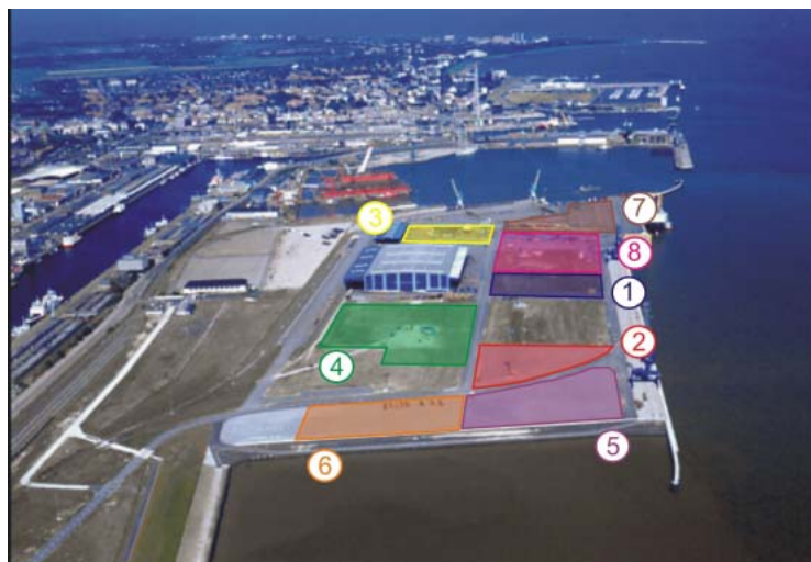
Abb. 2: Luftbild des CuxPort, Cuxhaven

Für die Beurteilung der Eintrittswahrscheinlichkeit extremer Tidehochwasserstände sind Aufzeichnungen des nördlich gelegenen Pegels Cuxhaven-Steubenhöft sowie des südlich gelegenen Pegels Otterndorf verwendet worden. Auf der Basis der jährlichen Tidehöchstwasserstände ist unter Voraussetzung der Log-Pearson 3-Verteilung für diese Pegel die Wasserstandsstatistik ermittelt worden (Abbildung 3). Durch Verschneidung des Höhenplans des Terminals mit den Wasserständen verschiedener Jährlichkeit ist schließlich den Jährlichkeiten die von Überflutung betroffene Terminalfläche sowie die zu erwartende Überflutungswassertiefe zugeordnet worden.