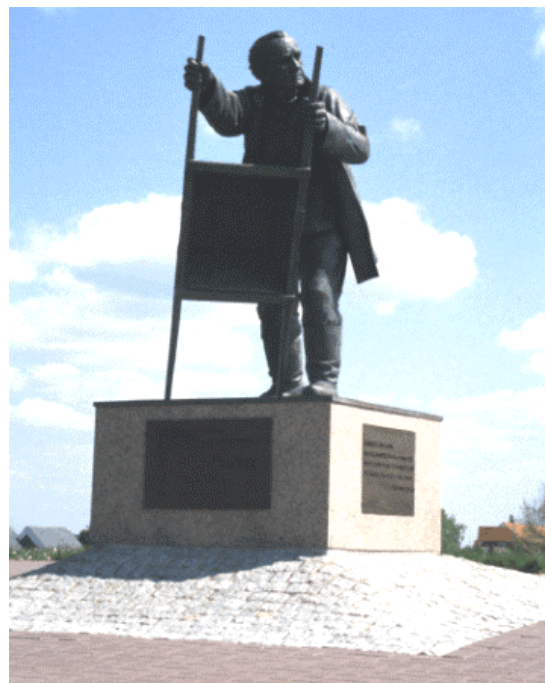
Abb. 2: Photographie des Deichdenkmals

Die Belastung des Fundamentes des Deichdenkmals (Abbildung 2) ergibt sich bei Sturmfluten durch am Hauptdeich auflaufende Wellen. Für den im Generalplan Küstenschutz, Niedersachsen, gegebenen Bemessungswasserstand von 5,95 mNN und der sich daraus über dem Vorland ergebenden Wassertiefe von 3,45 m wurde für einen Bemessungsturm der Windgeschwindigkeit von 35 m/s aus NW (Adolph-Berm-pohl-Orkan) der Bemessungsseegang am Hauptdeich aus einem Streichlängendiagramm nach SHORE PROTECTION MANUAL ermittelt. Bei dieser überschlägigen Betrachtung blieb der Einfluß des an der Vorlandkante vorhandenen Sommerdeichs unberücksichtigt. In ergänzenden numerischen Simulationen des Seegangs mit dem Modell SWAN wurden diese Ansätze überprüft. Abbildung 3 zeigt die signifikante Wellenhöhe im Watt vor Dorum-Neufeld. Es ergaben sich so am Deichfuß Wellenhöhen von etwa 1,30 m und Wellenperioden von 5,6 s.