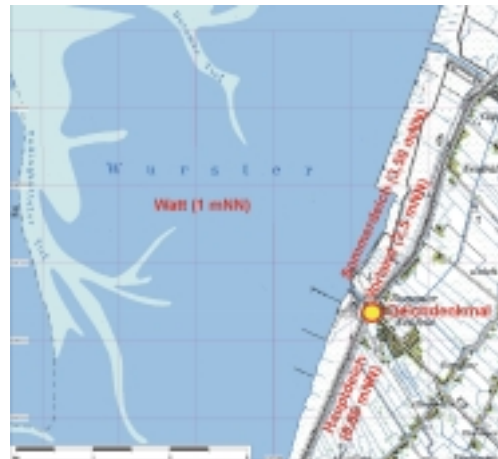
Abb. 1: Deichdenkmal in Dorum-Neufeld

Die Samtgemeinde Land Wursten plante im Bereich des Kutterhafens von Dorum-Neufeld auf dem Hauptdeich den Bau eines Deichdenkmals. Durch das FRANZIUS-INSTITUT waren für die Fundamentbemessung des Deichdenkmals die Wellenbelastungen zu berechnen und ein Ausführungsvorschlag für den Anschluß zwischen Fundament und Kleidecke des Hauptdeiches als Teil des Antrags auf deichrechtliche Ausnahmegenehmigung zu entwickeln. Im Rahmen des anschließenden gerichtlichen Beschwerdeverfahrens gegen die Ausnahmegenehmigung hatte das FRANZIUS-INSTITUT die gutachterliche Beratung des Landkreises Cuxhaven inne.